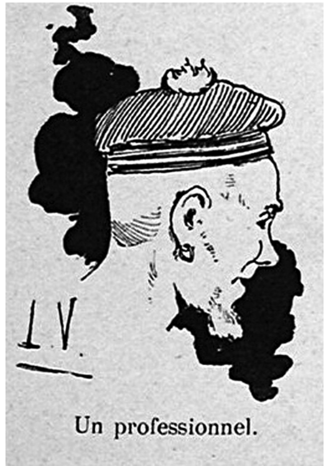
Gravure d'« un professionnel » dont les compétences sont convoitées à bord des yachts de course [Daryl, 1890 : 96].

Dépourvus d'un brevet de capitaine de plaisance, souhaitant néanmoins diriger eux-mêmes leur navire, les yachtsmen du XIX e siècle se réfèrent avec force au modèle de commandement en vigueur dans les marines professionnelles et plus particulièrement dans les marines d'État. Pour les amateurs issus de la petite et moyenne bourgeoisie, commander son yacht est l'occasion d'occuper un rôle d'autorité qu'ils n'exercent pas à terre. À bord, le capitaine est en effet considéré « comme un roi » [Larousse, 1876], « seul maître après Dieu ». Il doit veiller à faire respecter l'étiquette, c'est-à-dire l'observation de règles inspirées par la marine militaire : « Comme en tout à bord d'un yacht, le modèle à suivre est celui d'un navire de guerre [...] Toutes ces questions d'étiquette ont beaucoup plus d'importance à bord d'un yacht que sur un grand navire de commerce ou de guerre, précisément parce qu'elles tiennent lieu du code absent » [Daryl, 1890 : 300-306]. À la fin du siècle, l'identification des amateurs de plaisance au corps des officiers de marine est telle que le ministre de la Marine doit les rappeler à l'ordre car leurs costumes ressemblent trop à ceux des