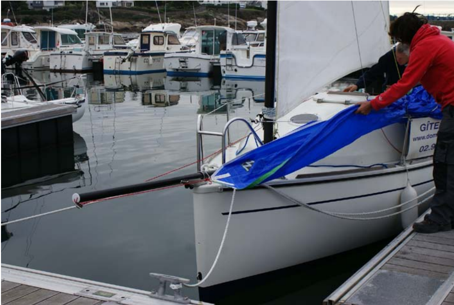
5) Hissez le point de drisse