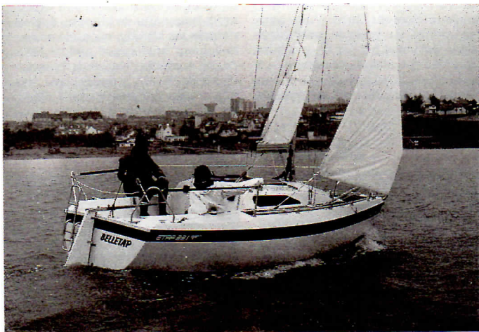
... tandis que l'Etap 22i se distingue par la qualité de son équipement et par une plus grande facilité de mise à l'eau.