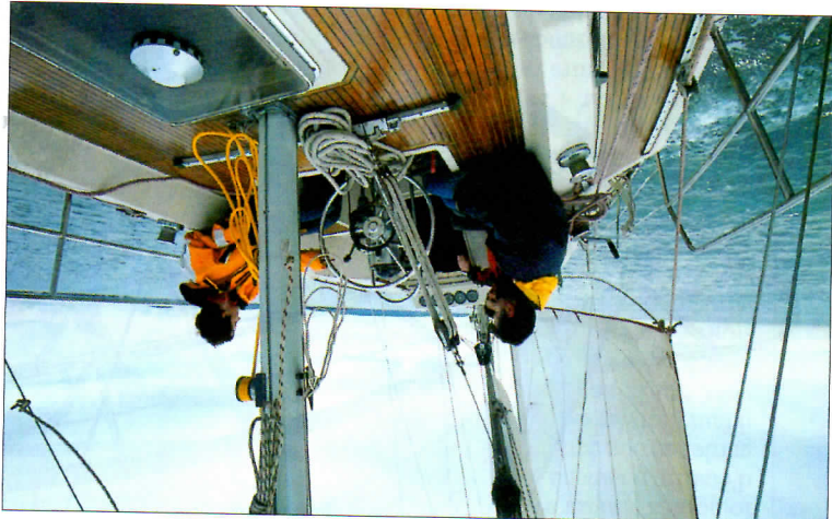
La plage arrière recouverte de teck se prolonge jusqu'au rouf au niveau du cockpit. Elle fait office de bancs.