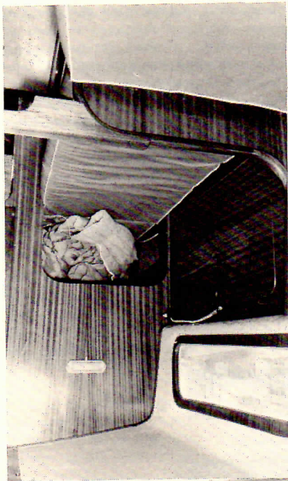
La table à cartes à tribord est rabattable sur cette couchette cerceuil.