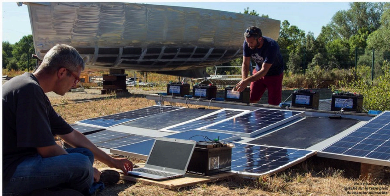
Notre banc d'essai installé sur le terre plein du chantier Alumarine.