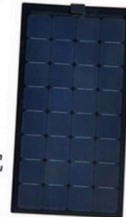
Par temps ensoleillé, la production d'un panneau solaire de 100 watts n'est pas négligeable.

production chutait. Ce dernier test a permis de constater que dans la plupart des cas, en masquant ainsi environ 10 % de la surface du panneau, on faisait chuter sa production de... près de 90 %. Seul un modèle, bénéficiant d'une conception différente, était réellement exempt de ce défaut. L'explication est assez simple: en règle générale, sur un panneau solaire, les cellules sont montées en série, ce qui fait que la production du panneau est celle de la cellule qui produit le moins. C'est un peu l'histoire du maillon faible... La solution consiste donc à diviser le panneau en trois ou quatre zones distinctes, mais peu de fabricants prennent cette précaution. Sur un bateau, il est important de prendre en compte ce problème puisque les objets susceptibles de faire de