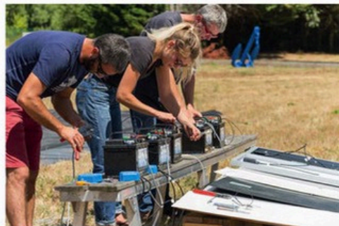
Le montage de notre banc d'essai. Chaque panneau était connecté à sa propre batterie afin de reproduire au mieux une situation réelle.

journée de tests ensoleillée, il a continué de produire jusqu'à 22 heures 30 alors que pour tous les autres, la production a cessé entre 20 heures et 21 heures. Enfin, pour ce qui est de l'effet des ombres, nous avons été frappés de constater que seul le panneau souple Solbian SP112Q était capable de maintenir une production significative dans ce cas de figure. A noter également que les panneaux souples sont globalement aussi ef-