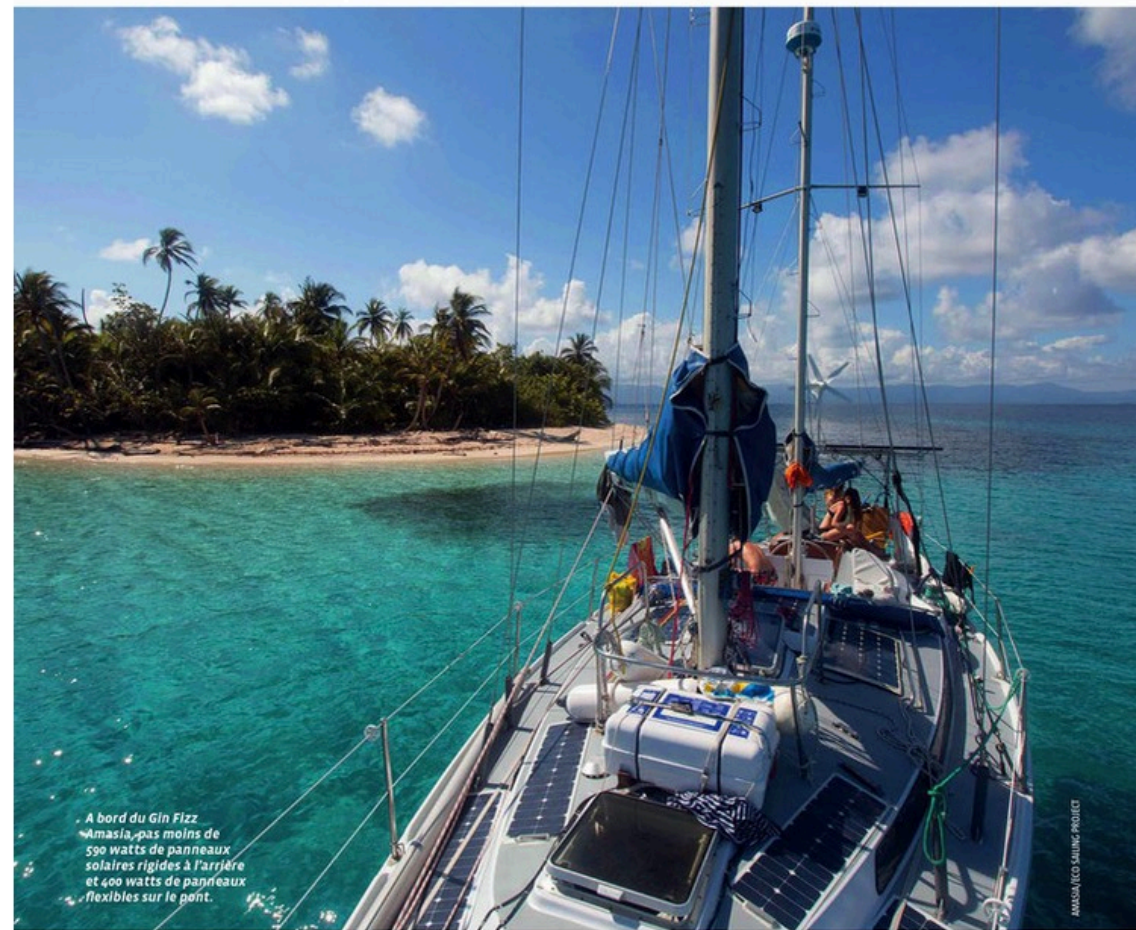
A bord du Gin Fliz, Amasia, pas moins de 590 watts de panneaux solaires rigides à l'arrière et 400 watts de panneaux flexibles sur le pont.

qui peut correspondre par exemple à une utilisation en période estivale, alors un rapide calcul montre qu'un panneau d'une puissance-crête de 100 watts produira en