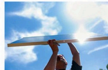
La puissance du Soleil est gigantesque, mais ce qui nous arrive sur Terre est tout de même bien plus modeste.

fois la consommation électrique mondiale annuelle (20000 térawattheures), et sa puissance représente environ 5 millions de milliards de fois la puissance électrique totale du parc nucléaire français.