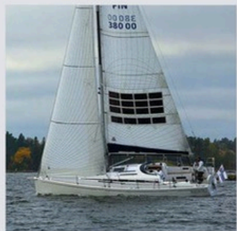
A bord de cet Arcona 380 Z, pas moins de 2 kilowatts de panneaux solaires au total... en comptant la voile.

bonne amure... Et surtout, il est possible de poser des surfaces importantes, ce qui permet de compenser un rendement de surface moindre. Solar Cloth System a en outre développé un partenariat avec le chantier suédois Arcona, dont les course-croisières sont disponibles dans une version «Z» pour zéro émission, équipée de ce genre de voiles solaires et d'un moteur électrique Oceanvolt (VV n° 545).