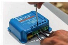
Ces régulateurs Victron nous ont permis d'enregistrer toutes les données de production.

A l'issue de ces tests, on peut tirer un certain nombre d'enseignements très utiles. Pour commencer, il s'avère que dans de bonnes conditions d'ensoleillement, la production d'un grand panneau 200 ou 150 watts est réellement significative: le plus performant à cet égard, lors de la première série de tests, donnait pas moins de 9 ampères une fois positionné à 90 degrés du rayonnement solaire, et encore 7 ampères posé à plat. Ce qui est largement suffisant pour alimenter, par exemple, un pilote automatique. Pour naviguer au portant dans des régions très ensoleillées, c'est à coup sûr plus intéressant qu'une éolienne qui aura du mal à tourner faute de vent apparent. Deuxième leçon à retenir: lorsque le soleil baisse, ou que le temps se couvre, la production chute très vite. De ce côté-là, il ne faut pas s'attendre à des miracles. Pour ce qui est de la production avec de faibles angles d'incidence, le modèle ERI-120FM (distribué par Navicom) a bien tiré son épingle du jeu puisqu'au cours de la première