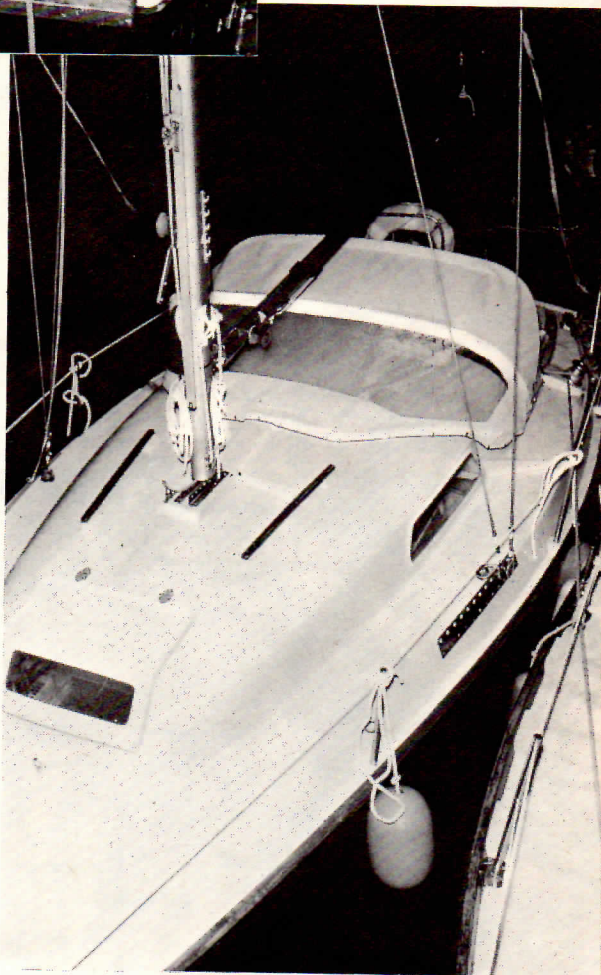
Le nouveau dessin du roof et du pont a permis d'augmenter l'habitabilité tout en respectant l'espace extérieur.

Les capacités de rangement du bateau sont telles qu'on risque, en croisière, d'avoir tendance à le surcharger, ce qui ne manquera pas de nuire à ses performances. A l'avant un vaste puits à mouillage peut aisément contenir (outre l'ancre,