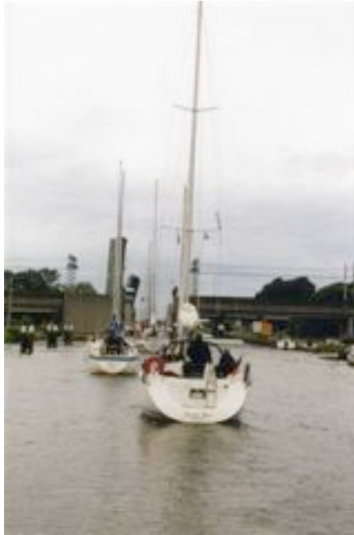
Le convoi arrive à un pont

Fréquemment, les passages d'écluses ou de pont peuvent générer la création de convois pouvant atteindre plusieurs dizaines de bateaux qui se déplacent à 6 nœuds environ. Dans ce cas, il faut s'efforcer de rester dans le convoi, si possible plutôt vers la tête, ce qui permet de choisir le côté favorable pour s'amarrer. En outre, cela permet de ne pas manquer les ponts et sas suivants si le convoi s'allonge ou se fragmente. Certains skippers, par contre, préfèrent entrer dans le sas en dernier, pour éviter la bousculade, mais alors dans ce cas, on est obligé de s'amarrer comme on peut ! Question de choix personnel.