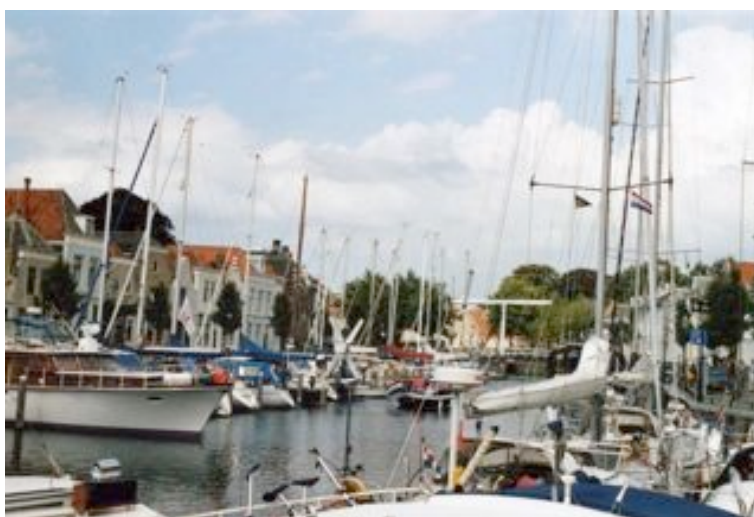
Goes : port municipal

Il est également possible d'aller jusqu'au centre de la ville, après le St Maartensbrug, où la profondeur disponible est de 1,50 à 2,00m.