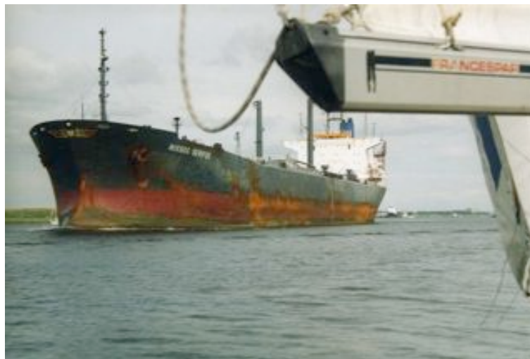
Nordzeekanal, attention aux rencontres

Attention au trafic des gros cargos et des barges et surtout à leur sortie des bassins de la rive sud.