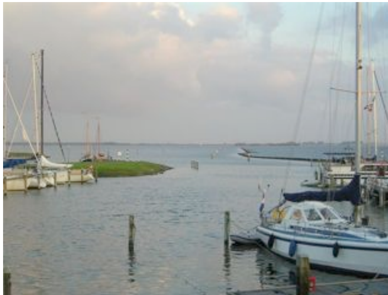
Herkingen et son chenal

Juste en face de Bruinisse se trouve Herkingen où l'on accède par un long chenal rectiligne balisé. Il n'y a pas de places dans le vieux port (Oude Haven), mais une marina de chaque côté de l'entrée.