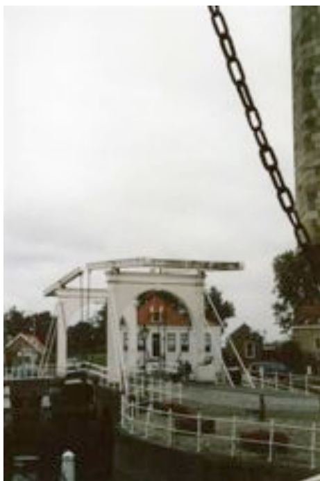
Zierickzee : Oude Haven