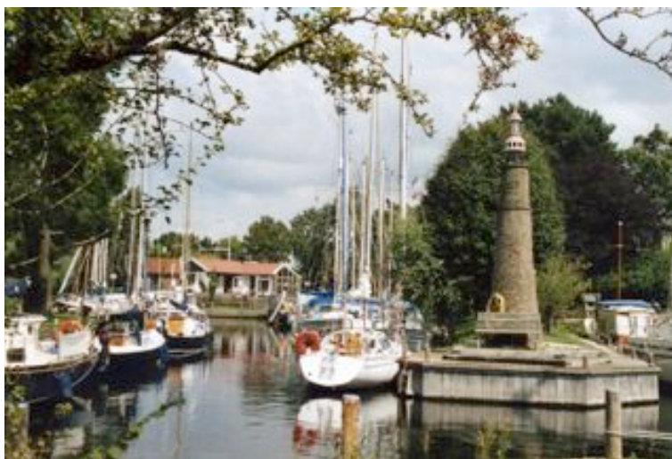
Goes : VW De Werf et le phare des méditations...

Il est également possible d'aller jusqu'au centre de la ville, après le St Maartensbrug, où la profondeur disponible est de 1,50 à 2,00m.