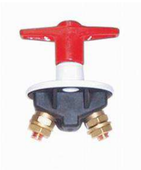
modèle à préférer

prévoir aussi un gros bornier déporté pour rassembler toutes les connections plutôt que de charger la borne du coupe batterie