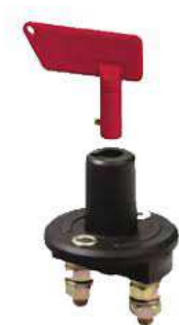
modèle à clef à éviter

3 coupe batterie (1 pour batt service, 1 pour batt moteur, 1 pour le MOINS, préférer les modèles à poignées par rapport aux modèles à clef, éviter les sélecteurs = source d'ennuis)