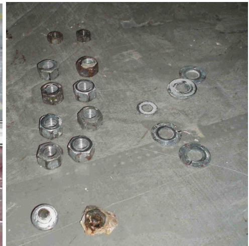
Sur les douze boulons, seuls deux étaient réellement oxydés, tous les autres étaient globalement en bon état...