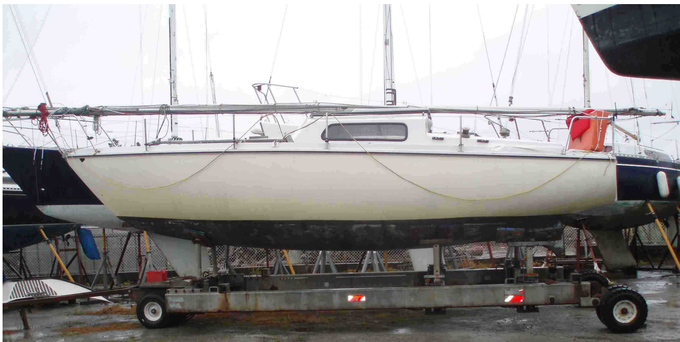
Le Sangria version dériveur intégral...