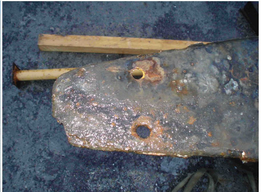
Agée de 40 ans, la quille est globalement en bon état, le chantier aura quelques trous à boucher après sablage.