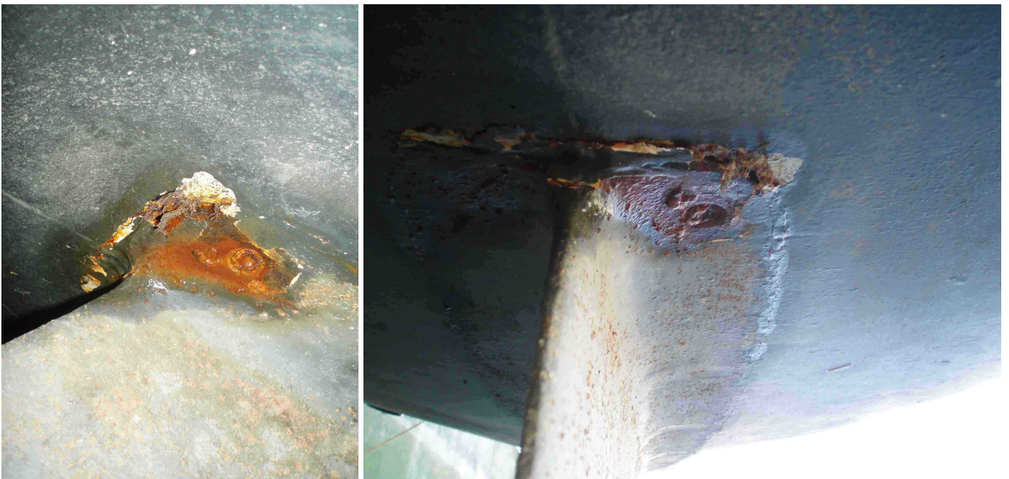
Extrémité de l'un boulons arrière fortement rouillé