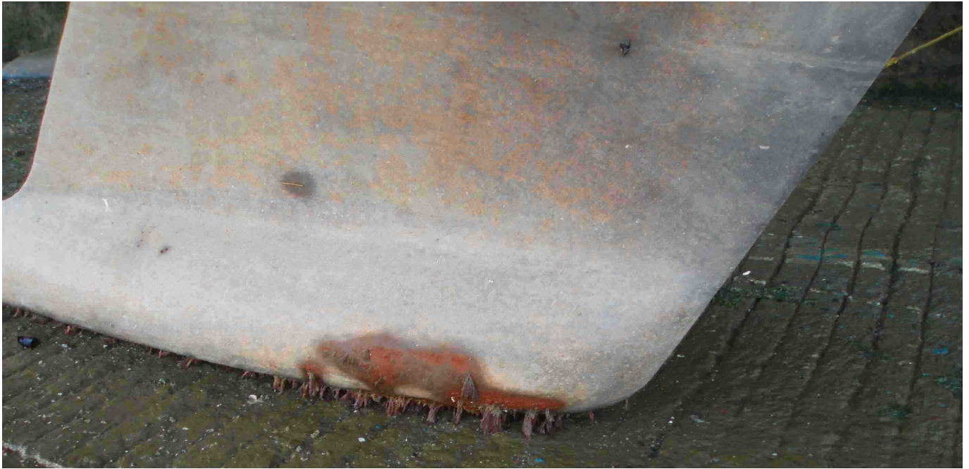
Apparition de rouille suite à une rencontre involontaire avec le fond de la mer d'Iroise...

Suite à plusieurs constats de présence de rouille et d'eau suintante au niveau du joint de quille, j'ai décidé de faire changer les boulons de quille de Lady M. Les travaux ont été réalisés par le chantier KVK de Brest.