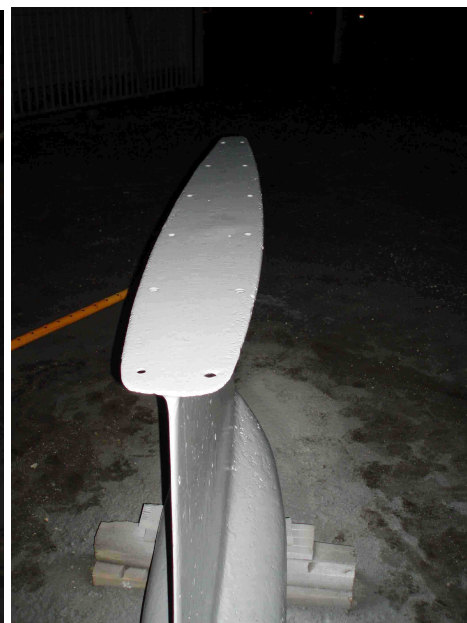
Prête à être reposée, c'est reparti pour 40 ans!