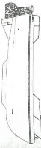
tableau arrière assez étroit rappellent le canot breton. Le cockpit est entièrement ouvert avec un coffre central pour protéger le moteur fixe. Bien : une coque bouchonnant par mer agitée sans risquer d'embarquer de l'eau. Un rételier pour les cannes sous le plat-bord... mais le capot moteur apparaît bien volumineux dans le petit cockpit.

Bien que dotée d'une petite quille d'échouage, la coque a été dessinée pour naviguer en semi-planage avec un hors-tout de 30 ch en puits. La silhouette reste toutefois celle d'un bateau de pêche-promenade classique avec sa haute timonerie. Le cockpit autour d'un abri profond de 70 cm. Bien : le pilote dispose d'un abri convenable haut de 1,90 m rare sur un bateau de 5 m... mais peu très confortable dans le clapot.